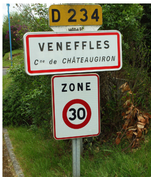
Une entrée en zone 30 généralisée